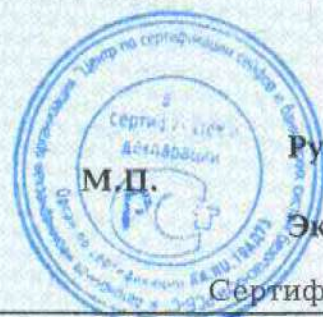
Схема сертификации - 1